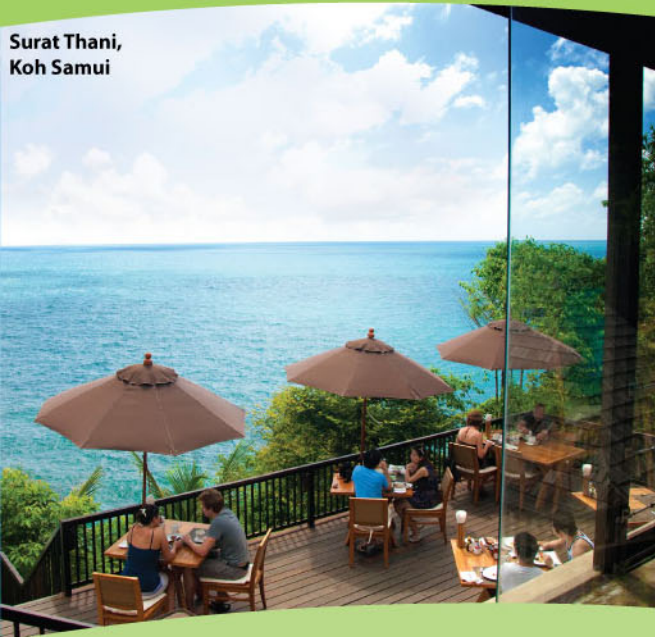
Surat Thani, Koh Samui