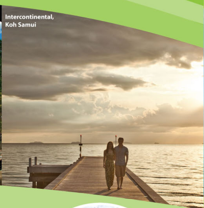
Intercontinental, Koh Samui