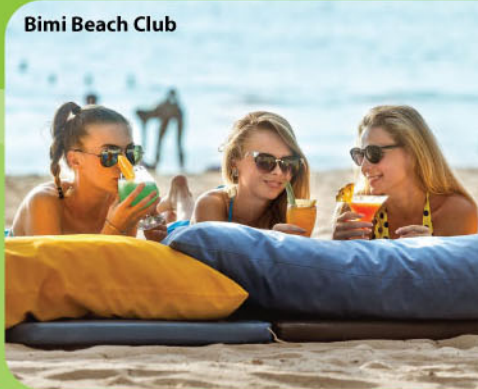
Bimi Beach Club