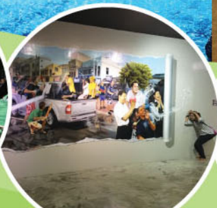
PHUKET TRICK EYE MUSEUM