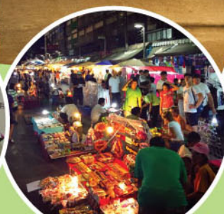
KRABI NIGHT MARKET