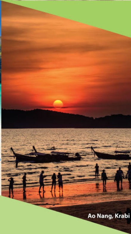
Ao Nang, Krabi