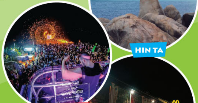
ARK BAR BEACH PARTY