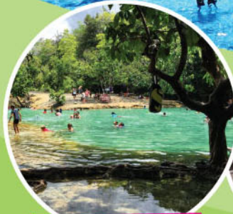
EMERALD POOL KRABI