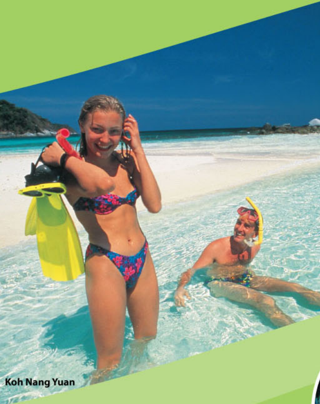
Koh Nang Yuan

Berbeda dengan Phuket yang terletak di Laut Andaman, pulau Ko Samui terletak di Gulf of Thailand, dan kini merupakan salah satu destinasi wisata premium terbaik di Asia Tenggara. Banyak selebriti serta kalangan bangsawan dunia memilih Ko Samui untuk berlibur, menikmati spa atau berbulan madu.