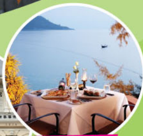
MOM TRI RESTAURANT