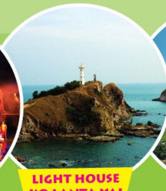
LIGHT HOUSE KO LANTA YAI