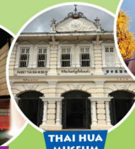
THAI HUA MUSEUM