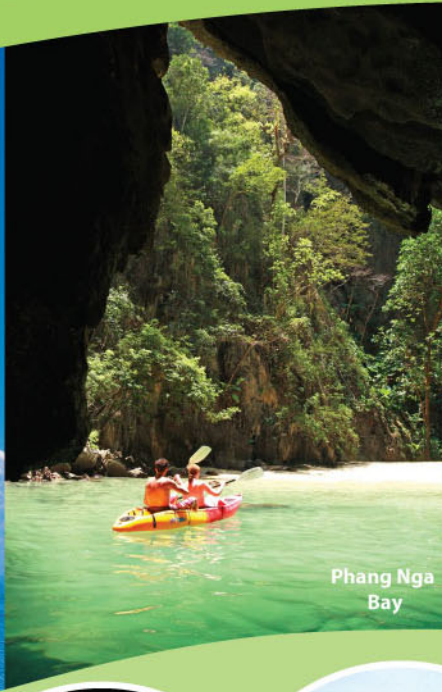
Phang Nga Bay