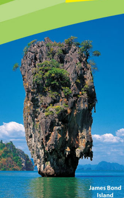
James Bond Island