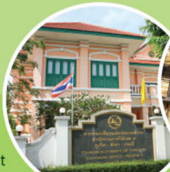
TOURISM AUTHORITY OF THAILAND