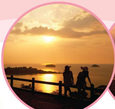
TRAT - KOH CHANG VIEW POINT