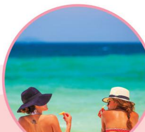
SEPARATED SEA, KRABI