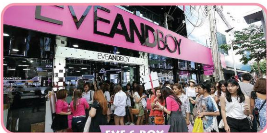
EVE & BOY

Untuk kosmetik, yang sekarang sedang tren adalah Eve and Boy, dengan berbagai cabang. Salah satu cabang terbesar ada di Siam Square (BTS Siam). Sedangkan untuk grosir, yang terkenal adalah di Soi Wanit (Chinatown Yaowarat) dan Jae Leng Plaza di dekat bandara Don Muang. Untuk kosmetik Korea, kini banyak tersedia di Show DC (tersedia van gratis dari MRT Cultural Center, Exit 2). Info lengkap tentang tempat belanja baca brosur SHOPPING.