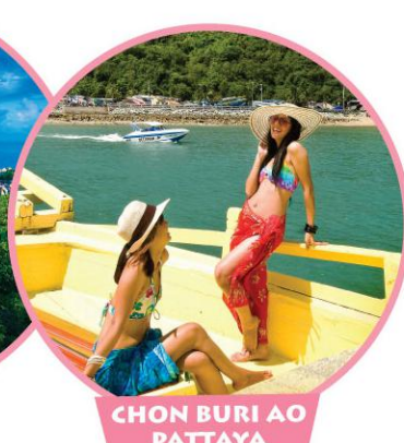
CHON BURI AO PATTAYA