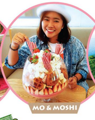
MO & MOSHI