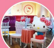
HELLO KITTY HOUSE